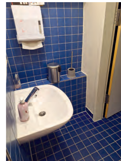
In den neuen Sanitärräumen ist die Farbe blau erhalten geblieben. Unten ein Bild aus der Abbruchphase.

Der Um- und Ausbau der Gebäudeteile und des Außengeländes des Startlochs bietet einen hohen Mehrwert für das Quartier und damit eine attraktive und zeitgemäße Jugendeinrichtung mit einem jederzeit öffentlich nutzbaren Außengelände mit Bewegungs- & Spielbereichen.