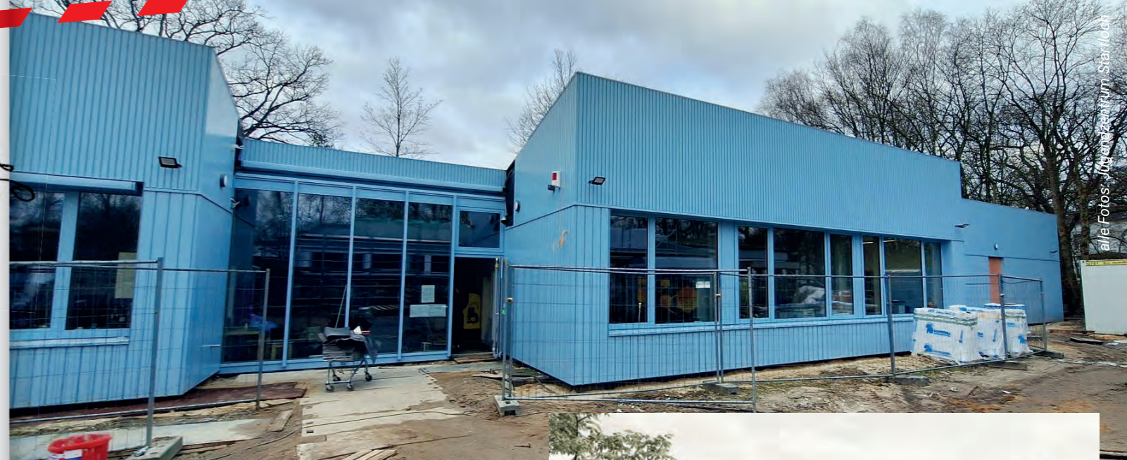
Die Außenfassaden lassen schon erkennen, wie der spätere Eindruck des gesamten Gebäudekomplex wird. Das Außengelände wird gemäß Architekturbüro-Zeichnung (rechts) noch bis Herbst fertig.