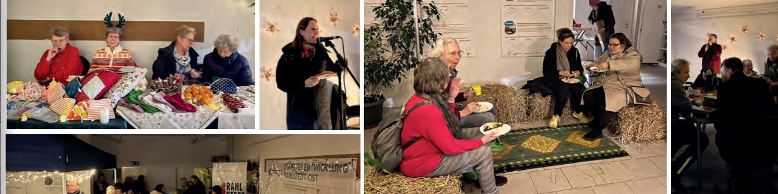
Auf Strohballen, am Stand der Nähgruppe, bei Dankesreden, Leckereien oder gemeinsamen Singen – die gemütliche Stimmung übertrug sich auf alle & das Stadtteilbüro war richtig gut besucht ...