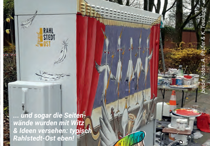
... und sogar die Seitenwände wurden mit Witz & Ideen versehen: typisch Rahlstedt-Ost eben!