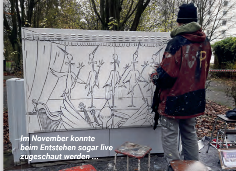
Im November konnte beim Entstehen sogar live zugeschaut werden ...

Die Zeitung wird vom Bezirksamt Wandsbek aus Mitteln des Rahmen- programms Integrierte Stadtteil- entwicklung finanziert.