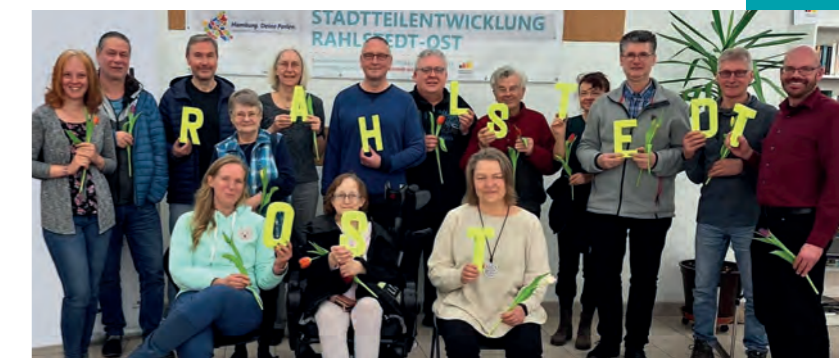
Unser Stadtteilbeirat bleibt weiter aktiv für Rahlstedt-Ost: Wir sagen Danke!

Neben den großen Infrastrukturprojekten gibt es auch viele kleinere Projekte wie die „Sportbox“ (ein neues Angebot, bei dem Sport- & Spielgeräte kostenlos ausgeliehen werden können), den Gesundheitstag (siehe S. 15), den 4. Fahrradaktionstag im April (siehe S. 5) oder auch die Fertigstellung der kunstvoll bemalten Stromkästen (siehe S. 3). Für alle, die sich gerne in der Gemeinschaft engagieren möchten, gibt es weiterhin zahlreiche Angebote im Stadtteilbüro , wie z.B. die Trommelgruppe, der Spiele- oder Näh-Treff, sowie viele Beratungsangebote (siehe S. 16).